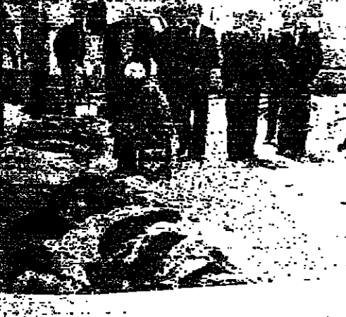
.. والمضاربة تارة